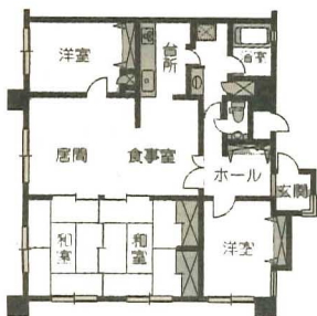
リフォーム前平面図

↑ 各室はすべてオープンに。扉を設けないことで、空間のつながりや広がりを感じられるよう工夫。来客時はロールスクリーンで対応